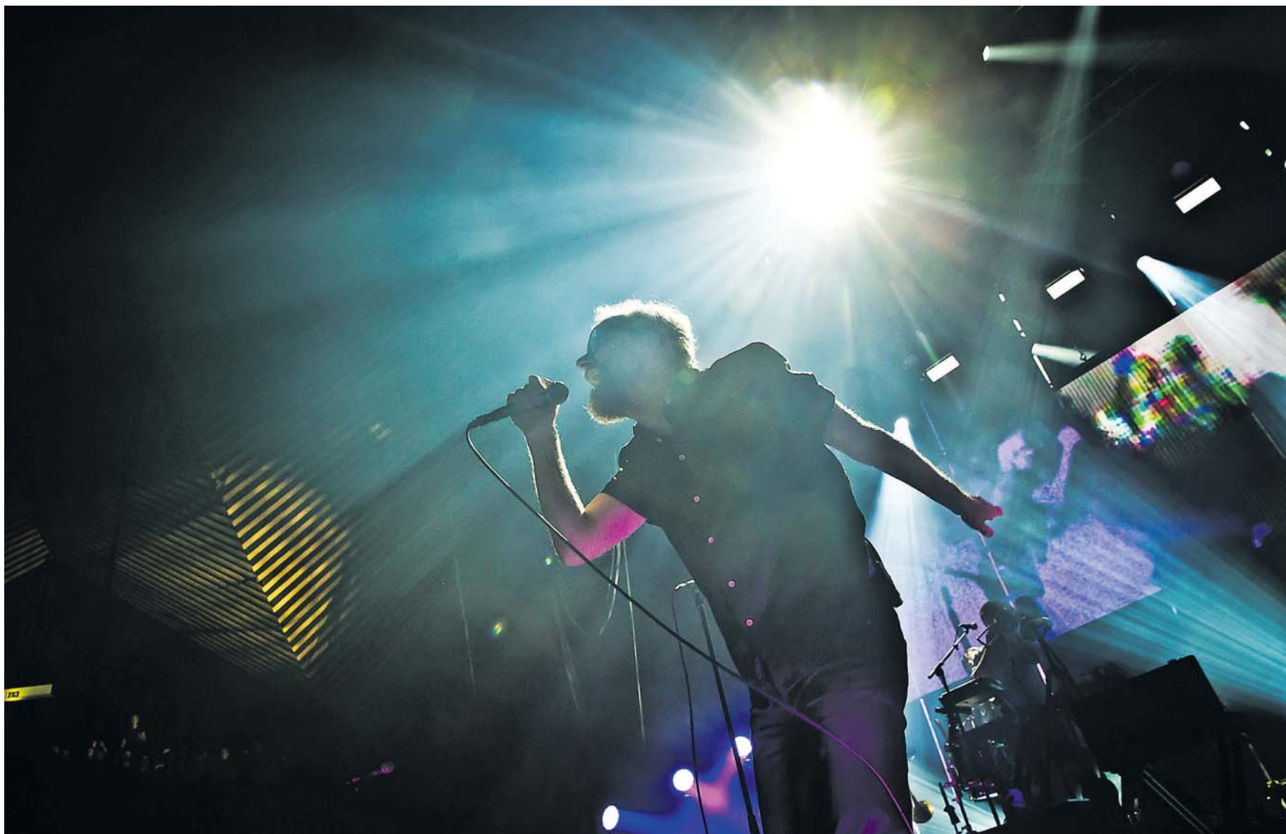
Zurückhaltung sieht anders aus, aber am liebsten stähle er sich auch hier bisweilen von der Bühne: Matt Berninger von The National im Berliner Tempodrom.