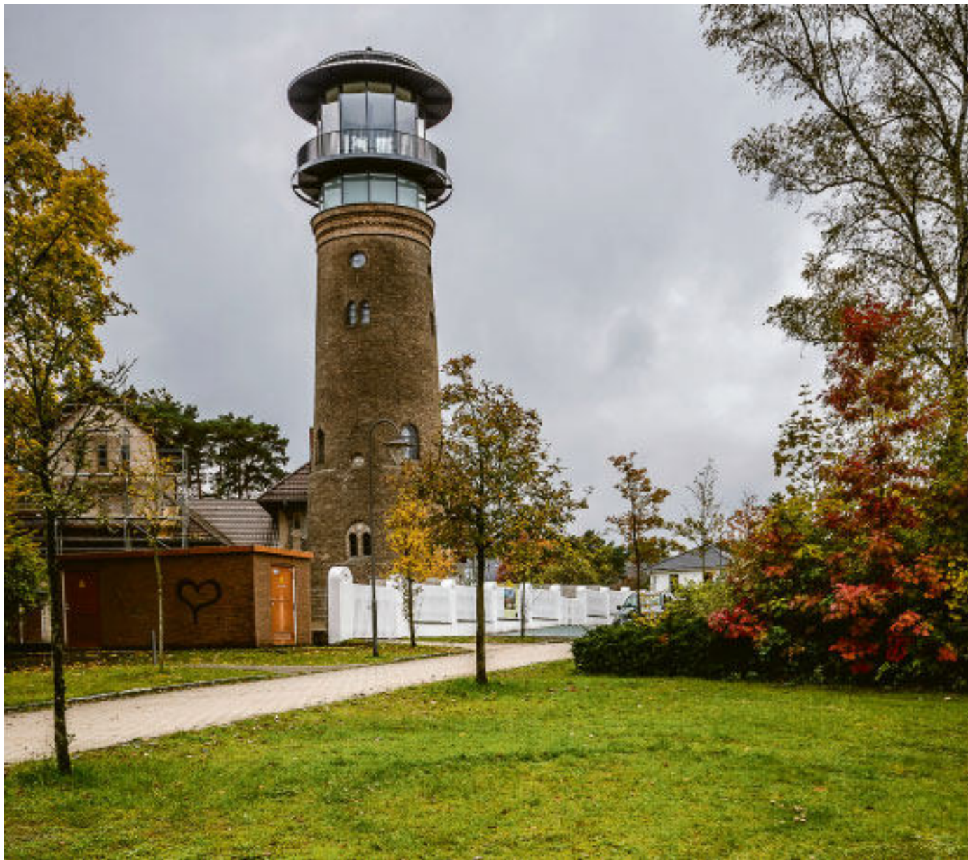
Über den Dingen leben – wenigstens für eine Nacht. Türme, in denen man schlafen kann, sind nicht nur bei Architekten beliebt.