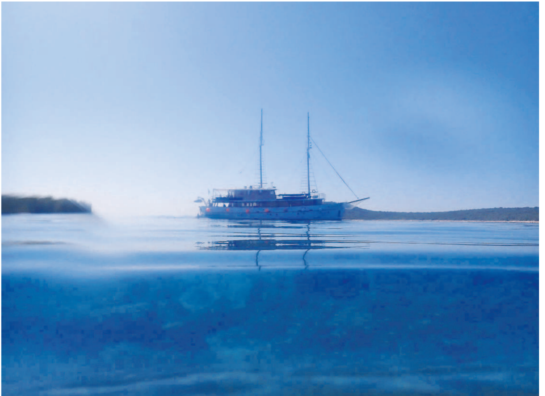
Badestopp auf der MS „Maček“: Während die Crew das Mittagessen vorbereitet, springen die Passagiere ins Mittelmeer.