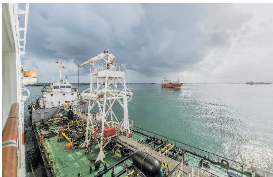
Ein Tankschiff wird kommen: Die MS „Fram“ wird mit Treibstoff befüllt.